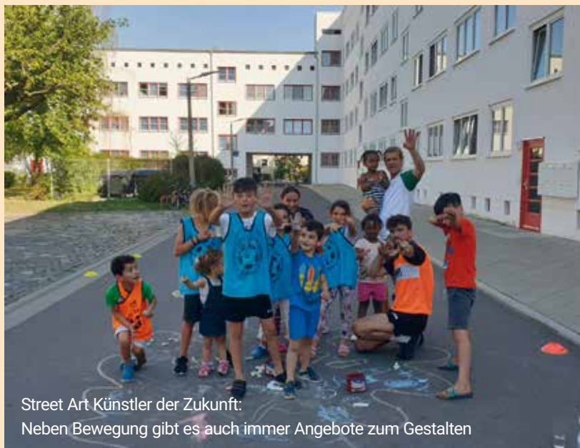
Street Art Künstler der Zukunft: Neben Bewegung gibt es auch immer Angebote zum Gestalten