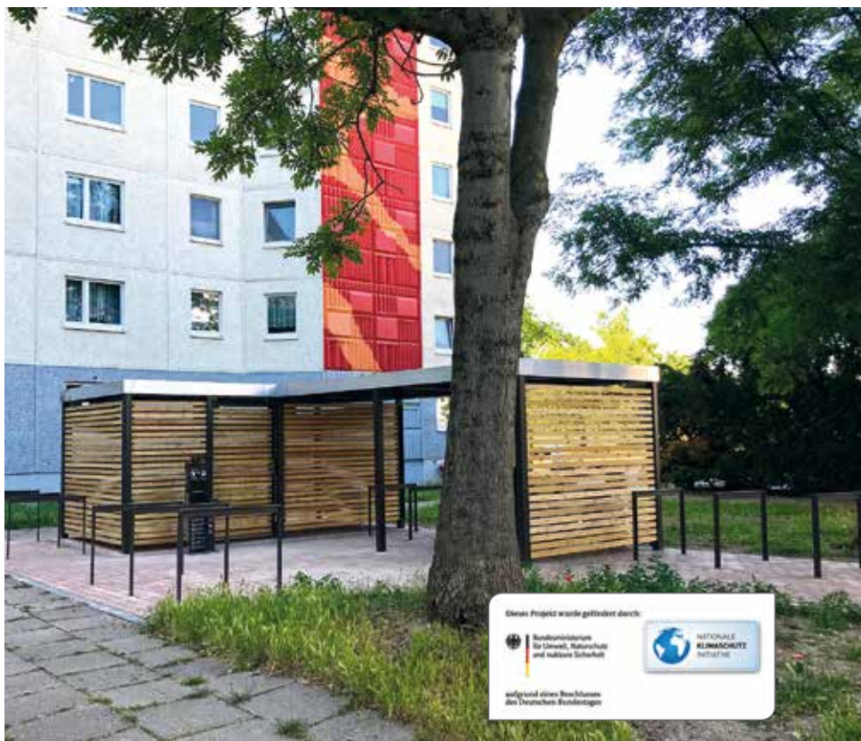
Radabstellanlage am Jakob-Kaiser-Ring 3 – 5

Komplettiert wird das Angebot durch eine Werkstatt, in der Kleinreparaturen möglich sind. Zudem verzichten viele unserer Mitarbeiter bereits auf das Auto und fahren mit Fahrrädern durch die Wohngebiete. Mehr emissionsfreier Verkehr ist für die Zukunft unerlässlich und wir beteiligen uns weiter aktiv daran, dafür gute Voraussetzungen zu schaffen.