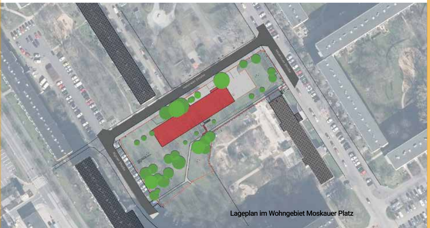
Lageplan im Wohngebiet Moskauer Platz

Der Spatenstich wird im Herbst diesen Jahres erwartet, so dass die Kita voraussichtlich Ende 2023 an die AWO übergeben werden kann.