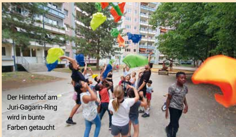
Der Hinterhof am Juri-Gagarin-Ring wird in bunte Farben getaucht