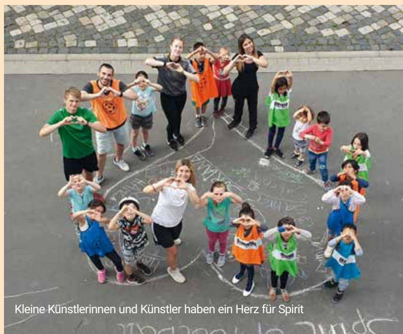
Kleine Künstlerinnen und Künstler haben ein Herz für Spirit