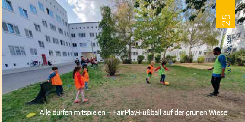
Alle dürfen mitspielen – FairPlay-Fußball auf der grünen Wiese

13. Jun (Mo), 4. Jul (Mo), 21. Jul (Do), 1. Aug (Mo), 11. Aug (Do), 22. Aug (Mo), 5. Sep (Mo), 26. Sep (Mo) immer 16 – 18 Uhr, Treffpunkt: Mainzer Str. 38 (Freifläche REWE)